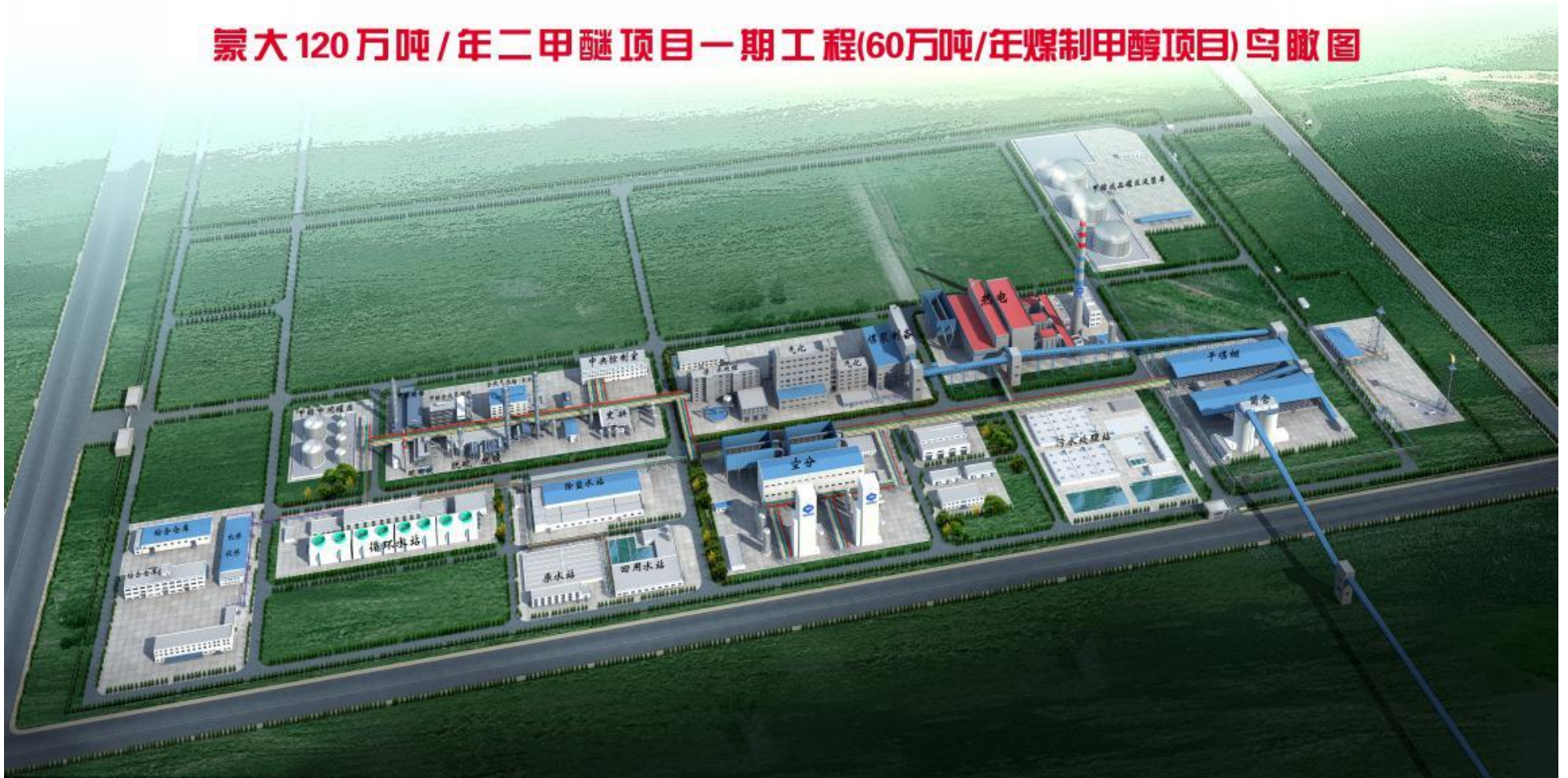
蒙大120万吨/年二甲醚项目一期工程(60万吨/年煤制甲醇项目)鸟瞰图